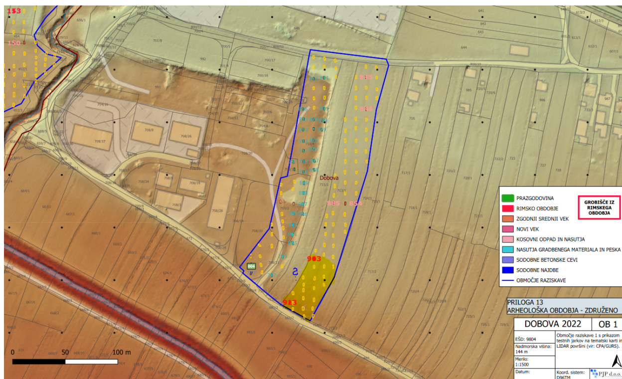
Slika 1a.,b.: Predlagana gradnja posega v registrirano enoto kulturne dediščine Dobova – Arheološko območje (EŠD 9804)